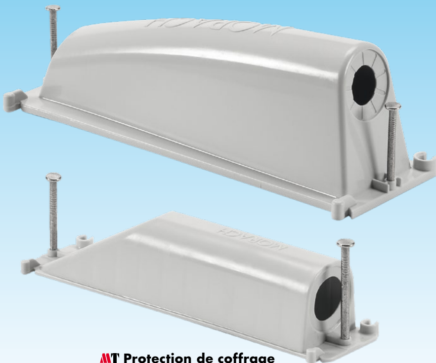
MT Protection de coffrage M20/M25 E-No 126 588 056 gris