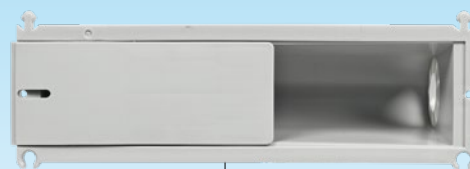
Stabilisierungselement für problemloses Entfernen des Schalungsschoners.